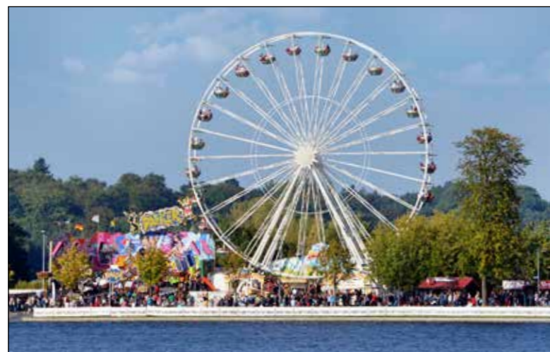
Das Riesenrad am Nordufer des Pfaffenteiches ist das Wahrzeichen des Altstadtfestes. Es ermöglicht einen Blick auf die Stadt aus 40 Metern Höhe

Die Festmeile erstreckt sich über zwei Kilometer rund um den Pfaffenteich bis in die Mecklenburgstraße hinein. Neben mehr als 200 Händlern, Schaustellern und Gastronomen präsentieren sich viele einheimische und überregionale Unternehmen. Auf verschiedenen Bühnen erleben die Besucher eine bunte musikalische Mischung von aktuellen Hits über Livemusik bis hin zu Oldies. Das Wahrzeichen des Festes – das 40 Meter hohe Riesenrad – wird auch in diesem Jahr seinen Platz am Nordufer finden. Ein Höhepunkt des Festspektakels wird sicher wieder das große Feuerwerk am Samstagabend.