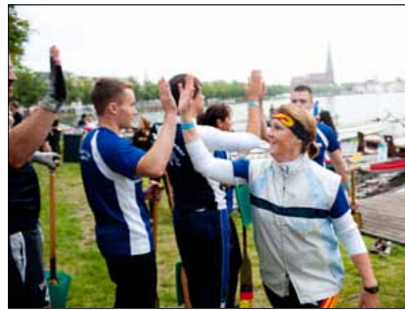
Bevor es losgeht, wird abgeklatscht - auch in diesem Jahr sind die Energy Dragons der Stadtwerke fit für den Start

Telefon 633 33 60 Technische Störungen Telefon 633 42 22