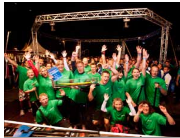
Die DREWAGianer konnten sich 2012 bereits zum zweiten Mal den Pokal in Form eines Drachenbootes erkämpfen

Pokal der Stadtwerke wird am 16. August zum zehnten Mal vergeben