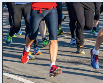
Die Stadtwerke gehen mit mehreren Läufern an den Start

Abhängigkeit von der Außentemperatur wird die Wassertemperatur nur bei Bedarf noch einmal erhöht und anschließend in das Fernwärmenetz eingespeist. Nach Fertigstellung des Gesamtprojekts im kommenden Jahr werden etwa 15 Prozent des Fernwärmebedarfs der Landeshauptstadt durch die Nutzung der erneuerbaren Erdwärme abgedeckt. Der erste Probebetrieb ist zum Start der kommenden Heizsaison geplant. Zusammen mit der stadtwerkeigenen Biogasanlage können zukünftig 20 Prozent der Fernwärme für die Landeshauptstadt aus regenerativen Quellen gewonnen werden. Julia Panke