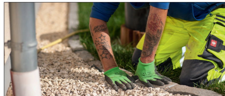
Nach Abschluss aller Bauarbeiten werden die Oberflächen auf dem Grundstück sowie auf Gehwegen und Straßen in den ursprünglichen Zustand gebracht