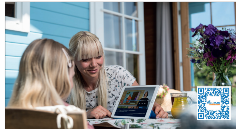
Hausaufgaben erledigen oder die Lieblingssendung der Kids im Schrebergarten schauen. Hierfür nutzen schon viele Kleingärtner das city.WLAN Schwerin

Für den Kleingartenverein „Erlengrund e.V.“ gehört dieses Angebot bereits seit der vergangenen Saison zum Alltag. Die Anlage wurde als erste in Schwerin an das öffentliche Stadtwerke-WLAN angeschlossen. Generell stehen jedem Nutzer 60 Freiminuten täglich gratis zur Verfügung. Hierbei ist ganz egal, ob das Handy oder das Tablet in einer Gartenanlage, an einem der 100 WLAN-Hotspots im Stadtgebiet oder in Bus und Bahn des Nahverkehrs mit dem city.WLAN verbunden ist. Mit einem Premium-Ticket lässt sich der Surfspaß ganz einfach erweitern, beispielsweise mittels digitalem Ticket über das city.WLAN-Einwahlportal direkt auf das Endgerät. Zudem ist ein umfangreiches Ticketangebot in den Kundencentern von SWS und NVS erhältlich. Premium-Ticketinhaber surfen in einem gesicherten WLAN-