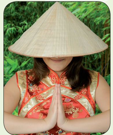
Asiatisch wird es im belasso mit vielen exotischen Angeboten