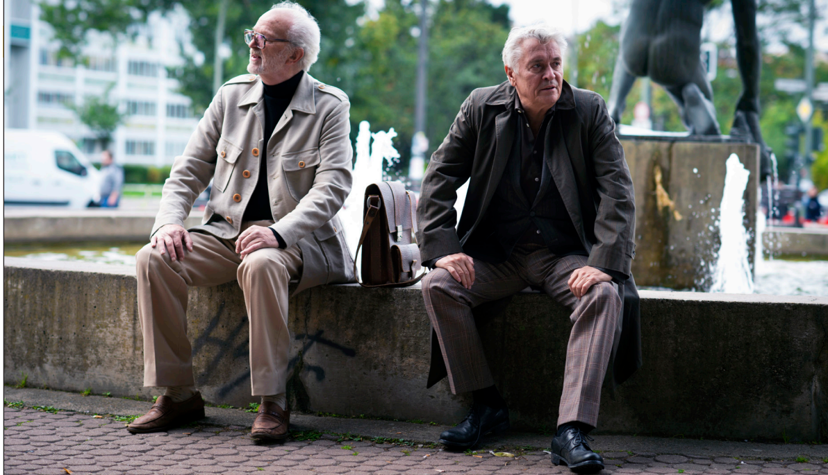
Beim 28. FILMKUNSTFEST MV wird es nicht nur den Film „Kundschafter des Friedens“ zu sehen geben – Hauptdarsteller Henry Hübchen wird als Stargast höchstpersönlich nach Schwerin kommen und mit dem Goldenen Ochsengeehrt